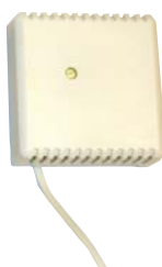
RUMSSENSOR: RJ9 kabel lågspänning, 3 m. Tilläggs-kit 25 meters RJ9 kablar (max 50 m).