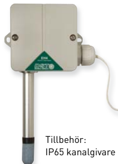
Tillbehör: IP65 kanalgivare