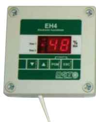
DISPLAY: RJ9 kabel, lågspänning, 25 m. Förlängningskit kablar, (max 200 m).