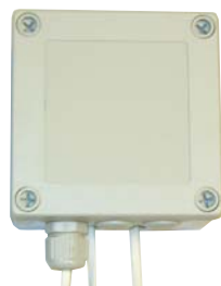
RELÄ: 230 V matning